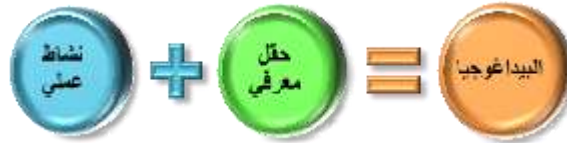
شكل (١) يوضح عناصر البيداغوجيا، من إعداد الباحثة

فما يحرزها طلاب الفن من أفكار عن التنوع الفني والعلاقات الجمالية المتجددة والتعبيرات الفنية بكل ما تحمله من مشاعر إنسانية أو إجتماعية، وكذلك جميع الإبداعات التقنية في الفنون التطبيقية تترجم إلى وسائل تبني عليها أسس وبرامج التربية الفنية، التي تهدف إلى التربية في؛ والتربية من خلال؛ والتربية عن طريق الفنون، ولها شقان شق نظري معرفي وآخر تطبيقي عملي، وكل منهما يغذي الآخر بهدف تنمية الإحساس والمشاعر والوجدان والعقل، والشكل (١) يوضح عناصر البيداغوجيا .