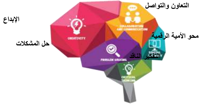
شكل (٨) يوضح توزيع المهارات علي الجانب الأيمن من دماغ الإنسان