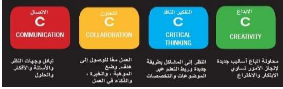
شكل (٧) يوضح مهارات القرن الحادي والعشرين (4CS)، لمنظمة الشراكة الأمريكية

إن هذه المهارات الأربع السابقة، تحدد سمات طالب المستقبل الذي تسعى وزارة التعليم العالي إلى بنائه وتأهيله، فمن ضمن أهداف الوزارة في تحقيق رؤية مصر ٢٠٣٠: "توفير التدريب لطلاب التعليم العالي وتزويدهم بمهارات التفكير والتعاون والمناقشة والإبداع، والتي يؤدي بالطلاب الذين يمكنهم تطوير قدراتهم بعد التخرج للحصول على ميزة تنافسية في سوق العمل".