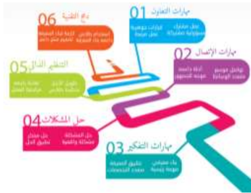
شكل (٩) يوضح العلاقة الأرتباطية بين مقومات بيداغوجيا الإبداع ومقومات مهارات القرن الحادي والعشرين

ويعتبر تعليم الفنون بمثابة قناة حاسمة لتحفيز مخيلة طلاب التربية الفنية، فالفنون تشجع علي الإبداع، وتعتبر المخيلة أو الإبداع أو القدرة علي رؤية الصور والأفكار وخلق أشياء فريدة من نوعها؛ وذات قيمة للمجتمع بمثابة طاقات من شأنها أن تحدث فرقاً في الحياة . (منظمة العمل الدولية واليونسكو، ٢٠١٠، ص٢٤) ويؤدي التركيز علي الإبداع والفنون إلي تطوير المهارات الشخصية والاجتماعية للطلاب الممارسين للفن، بما في ذلك تعزيز الشعور بالهدف والاتجاه وزيادة الثقة بالنفس والحماسة لإيجاد عمل، نتيجة تمتعهم وإهتمامهم بالصناعات الإبداعية وبمهارات التواصل، من خلال التفاعل ما بين الخيال وعمليات التعلم العقلاني، فيصبح في إمكان الشباب أن يتصوروا ويتخيّلوا واقعاً مختلفاً لأنفسهم ولمجتمعهم . (منظمة العمل الدولية واليونسكو، ٢٠١٠، ص٢٦)، والشكل (٩) الذي يوضح العناصر الرئيسية للبيداغوجيا الإبداعية .